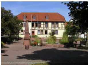
Großrinderfeld bietet Interessantes aus allerlei Themengebieten.

Die Veranstaltungen finden in der Aula der Grundschule Großrinderfeld statt. Soweit nicht anders angegeben, ist der Einlass um 19:45 Uhr, Beginn um 20:00 Uhr und Ende gegen 21:15 Uhr. Der Eintritt ist kostenfrei.